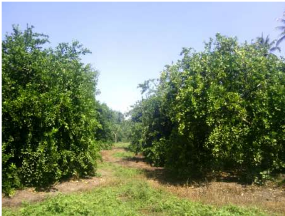
Huerta de limón en el estado de Colima

De los puntos de campo levantados en 2022, se encontró que la mayor parte corresponden a los cultivos de caña de azúcar, cítricos y plátano.