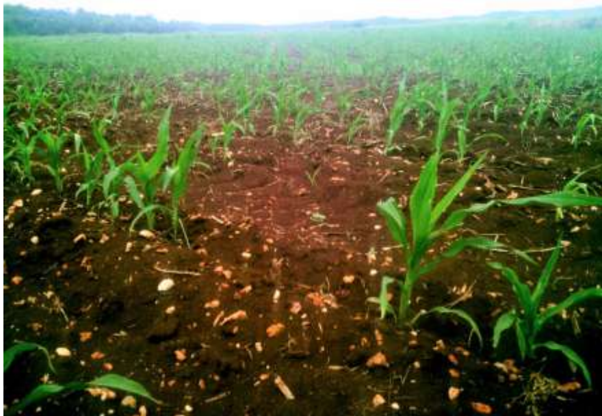
Ilustración 1 Parcela de maíz en el estado de Campeche

De los puntos de campo levantados en 2022, se encontró que la mayor parte corresponden al cultivo de maíz, por lo que es este producto, el que predomina en el estado de Campeche.