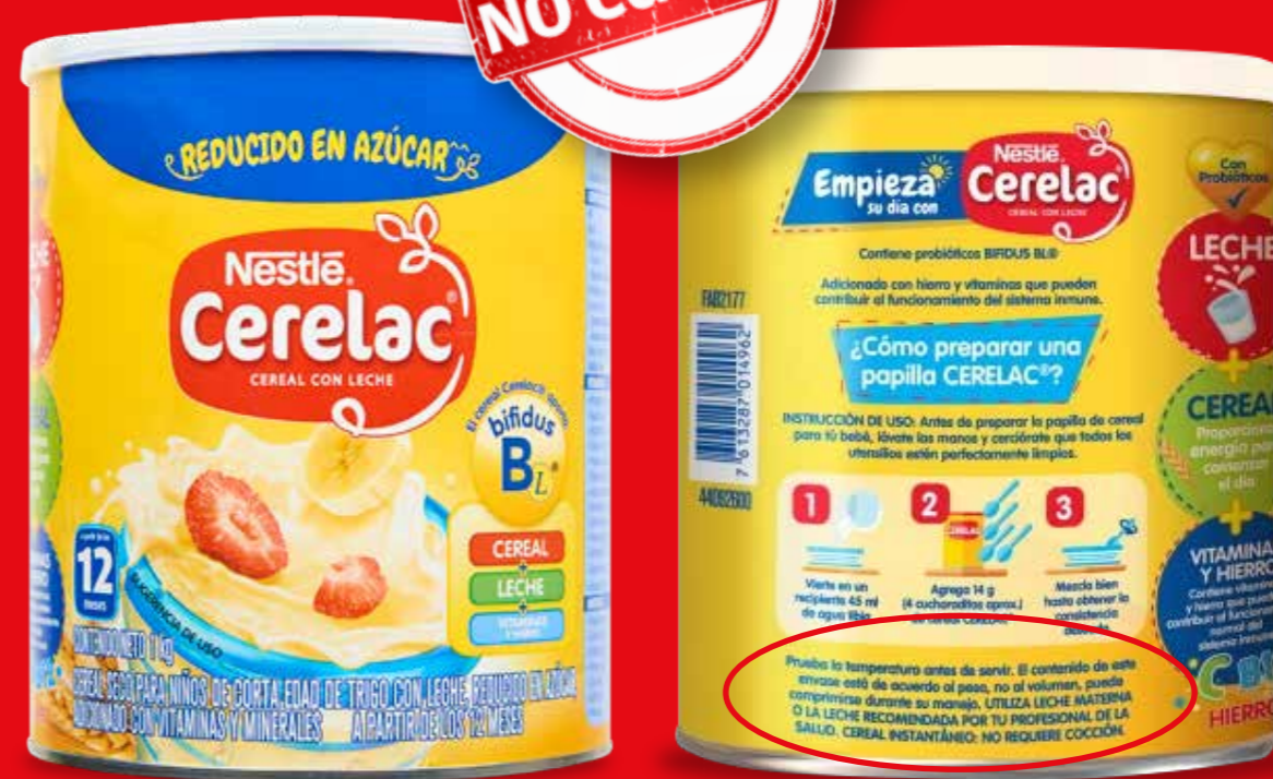
Cerelac Nestlé / Cereal con leche reducido en azúcar

Los productos que no cumplen con las Normas Oficiales Mexicanas pueden ser sujetos a medidas precautorias, y sus proveedores a requerimientos y en su caso a procedimientos por infracciones a la ley.