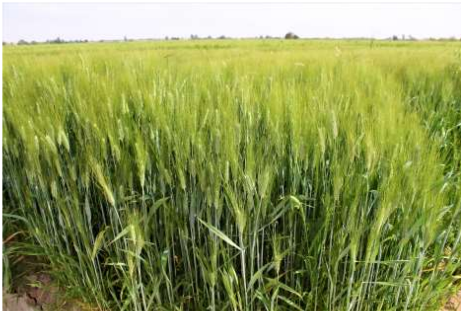
Ilustración 1 Parcela de trigo en el Valle de Mexicali, Baja California

De los puntos de campo levantados en 2022, se encontró que la mayor parte corresponden a los cultivos de trigo y alfalfa, por lo que son estos productos los que predominan en el estado de Baja California.