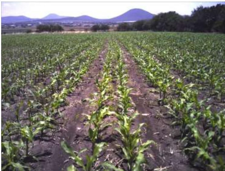
Ilustración 1 Parcela de maíz en el estado de Aguascalientes

De los puntos de campo levantados en 2022, se encontró que la mayor parte corresponden al cultivo de maíz, por lo que es este producto, el que predomina en el estado de Aguascalientes.