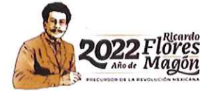
Evidencia actividad 4.1.1.