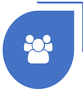
Tra Sesión Ordinaria del CONCNH

El 26 de octubre de 2021, el Órgano de Gobierno de la CNH emite el acuerdo por el que se designa al Presidente del CONCNH, así como a su suplente e instruye la instalación y formalización del Comité.