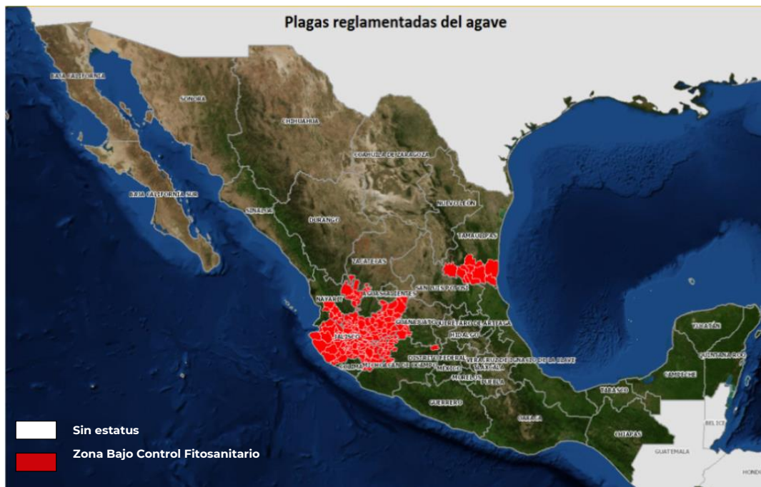
Figura 1. Estatus fitosanitario de plagas reglamentadas del agave en el mes de noviembre de 2022.

En el mes de noviembre a nivel nacional se reportó un nivel de infestación de 4.4 picudos por trampa, siendo en los estados de Guanajuato y Jalisco donde se reportaron las más altas infestaciones de picudo con un promedio de 8.1 y 5.1 picudos/trampa, respectivamente. Mientras que en Michoacán los niveles de capturas se mantienen por debajo de 2 picudos/trampa (Gráfica 1).