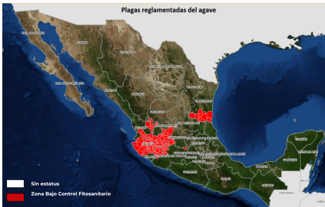
Figura 1. Estatus fitosanitario de plagas reglamentadas del agave en el mes de junio de 2022.

En el mes de junio se reportó para los estados de Guanajuato y Michoacán un promedio de capturas de 5.2 y 1.1 picudos/trampa, respectivamente (Gráfica 1).