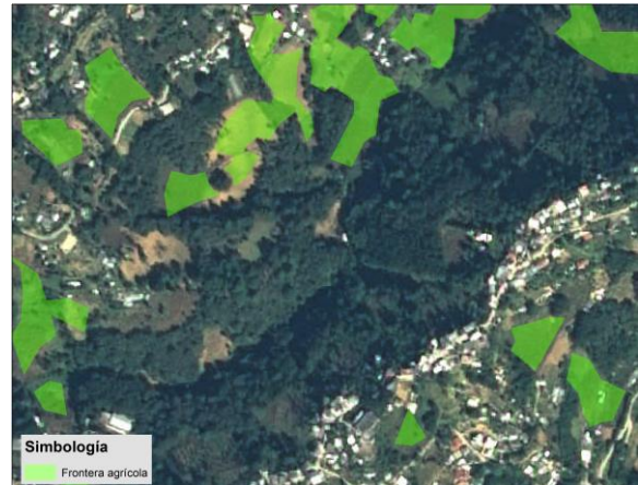
Municipio de Astacinga, 2021