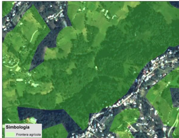
Municipio de Astacinga, 2018

En las siguientes imágenes se presenta un ejemplo comparativo en el que se muestran cambios de ambas series.