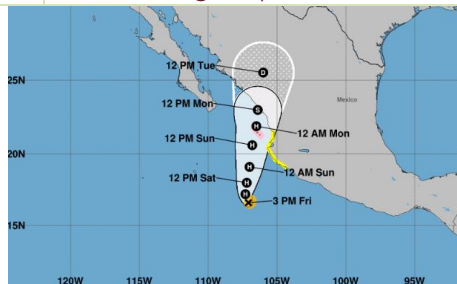
1730 hrs 28/09/22