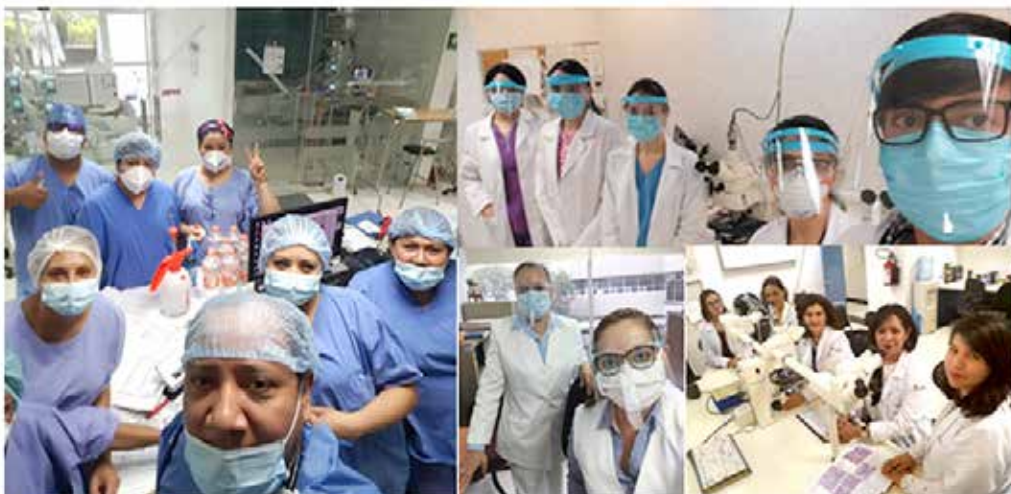
Personal de atención a la salud durante la pandemia por COVID-19

Así realizamos la primera sesión extraordinaria del CHB durante la pandemia, teniendo apenas 24 días de ser hospital COVID, se acercó uno de mis compañeros para solicitar se discutiera una intervención quirúrgica a un paciente con COVID-19. Se convocó, no se podía utilizar la sala de juntas de la dirección y no estaba muy familiarizada con la plataforma para convocar a la sesión, somos 10 integrantes del comité y se invitó a 5 médicos más, involucrados con el tratamiento del paciente ya que el abordaje multidisciplinario era obligado, así que solicité su presencia en el estacionamiento del hospital bajo la sombra de una gran jacaranda. Todos con sus cubrebocas, caretas, uniformes médicos y manteniendo una distancia prudente, fue como iniciamos con la primera sesión en tiempos de pandemia, altamente fructificante. La sesión subsecuente con el segundo caso ha sido a través de la plataforma Teams , con un aforo del 70% y estando algunos integrantes en comunicación desde su casa, en esta nueva normalidad. (6)