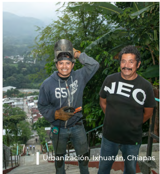
Urbanización, Ixhutatán, Chiapas

Banobras destinará los recursos netos obtenidos de su Bono Sustentable con Perspectiva de Género para financiar o refinanciar, total o parcialmente, directa o indirectamente (a través de líneas de crédito para otras instituciones financieras), Proyectos Elegibles que pertenezcan a alguna de las Categorías Elegibles listadas y detalladas a continuación.