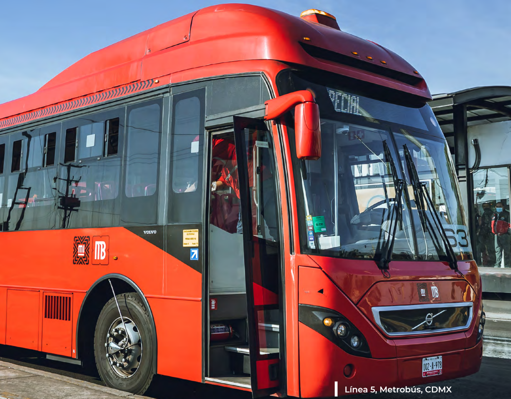
Línea 5, Metrobús, CDMX