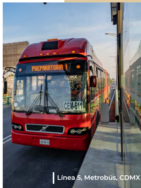
Línea 5, Metrobús, CDMX

Los productos y servicios de Banobras satisfacen las necesidades financieras de los gobiernos subnacionales, el financiamiento de proyectos, así como el de las empresas productivas del estado.