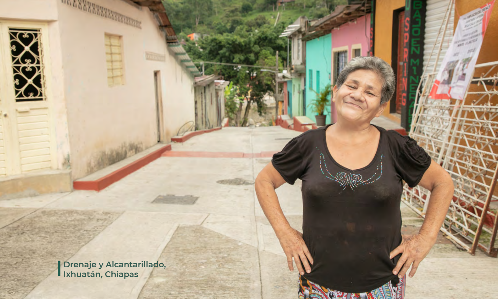
Drenaje y Alcantarillado, Ixhucatán, Chiapas

Los proyectos de infraestructura relacionados con el rubro “Urbanización” se encuentran establecidos en los Lineamientos 6 del Fondo de Aportaciones para la Infraestructura Social (FAIS). En el caso de estos proyectos, Banobras otorga financiamiento siguiendo las disposiciones establecidas en la Ley de Coordinación Fiscal: