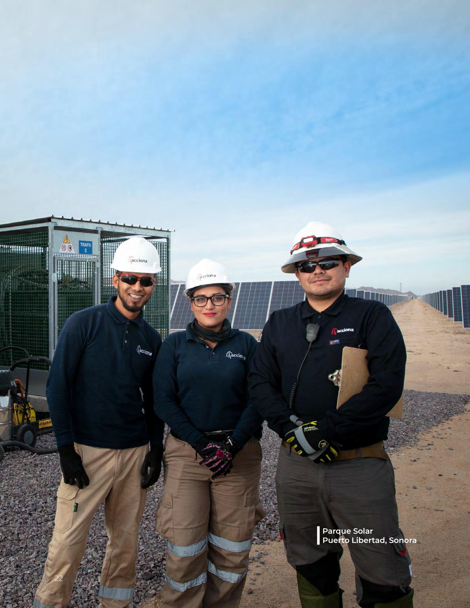
Parque Solar Puerto Libertad, Sonora