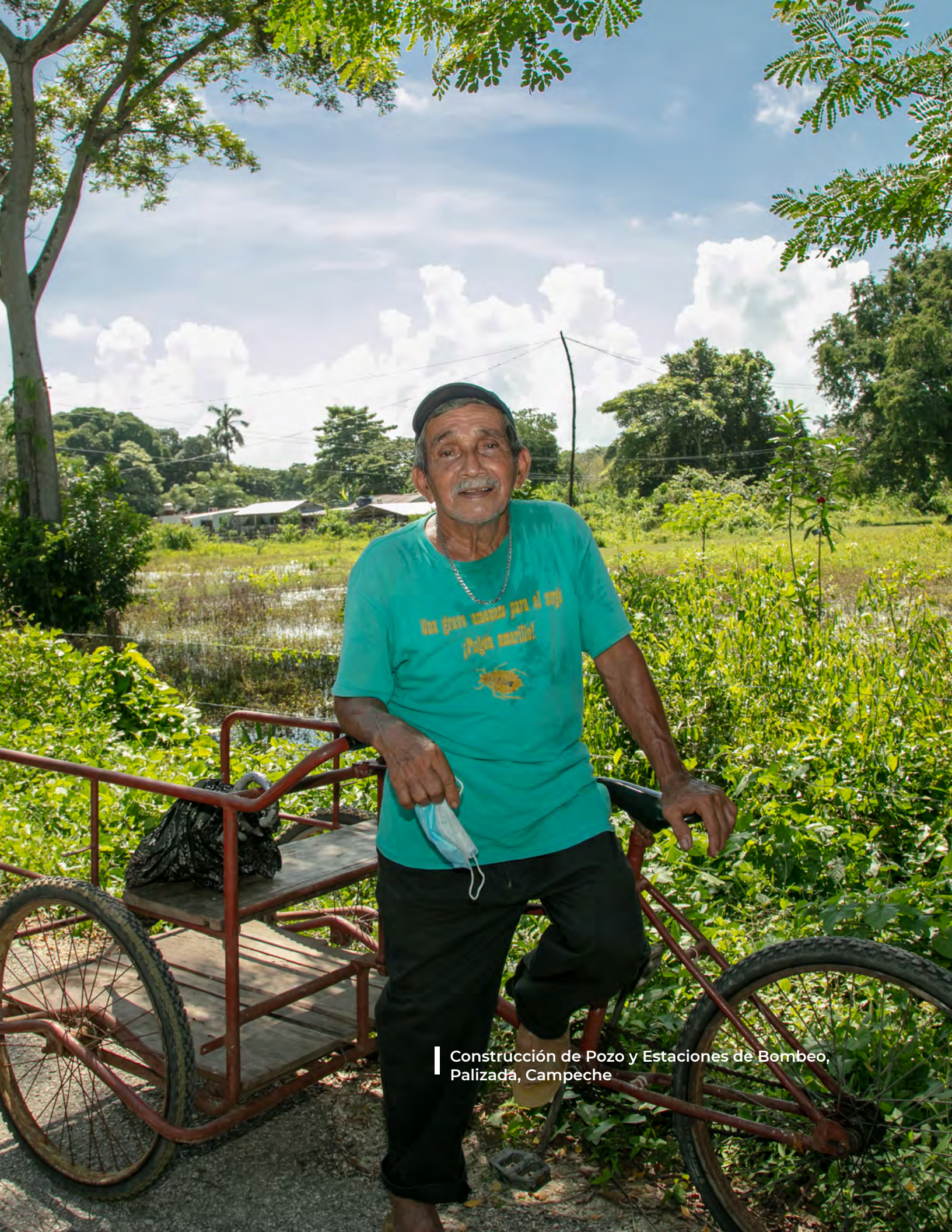
Construcción de Pozo y Estaciones de Bombeo, Palizada, Campeche