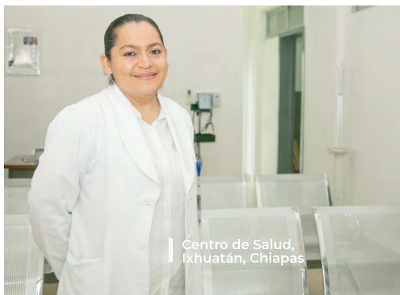
Centro de Salud, Ixhuatán, Chiapas

C) Acondicionamiento, mantenimiento, renovación y desarrollo de mercados públicos, donde la población pueda tener acceso a productos de consumo básico dentro de sus localidades, o construcción y adecuación de oficinas y/o edificios públicos para facilitar el acceso de las mujeres, población vulnerable, a diferentes tipos de servicios en el mismo espacio físico (generalmente relacionados con salud sexual y reproductiva, capacitación laboral y desarrollo empresarial, y servicios para sobrevivientes de violencia contra las mujeres).