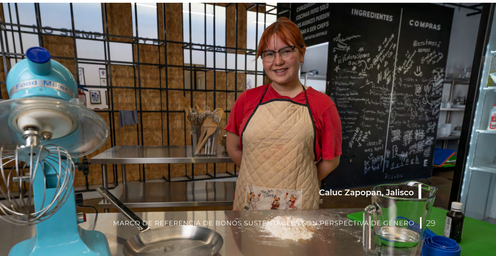
Caluc Zapopan, Jalisco

El SARAS es operado por un área técnica especializada, denominada Unidad de Gestión Ambiental y Social (UGAS), a cargo de la Gerencia de Gestión de Riesgos Ambientales y Sociales dentro de la Dirección General Adjunta de