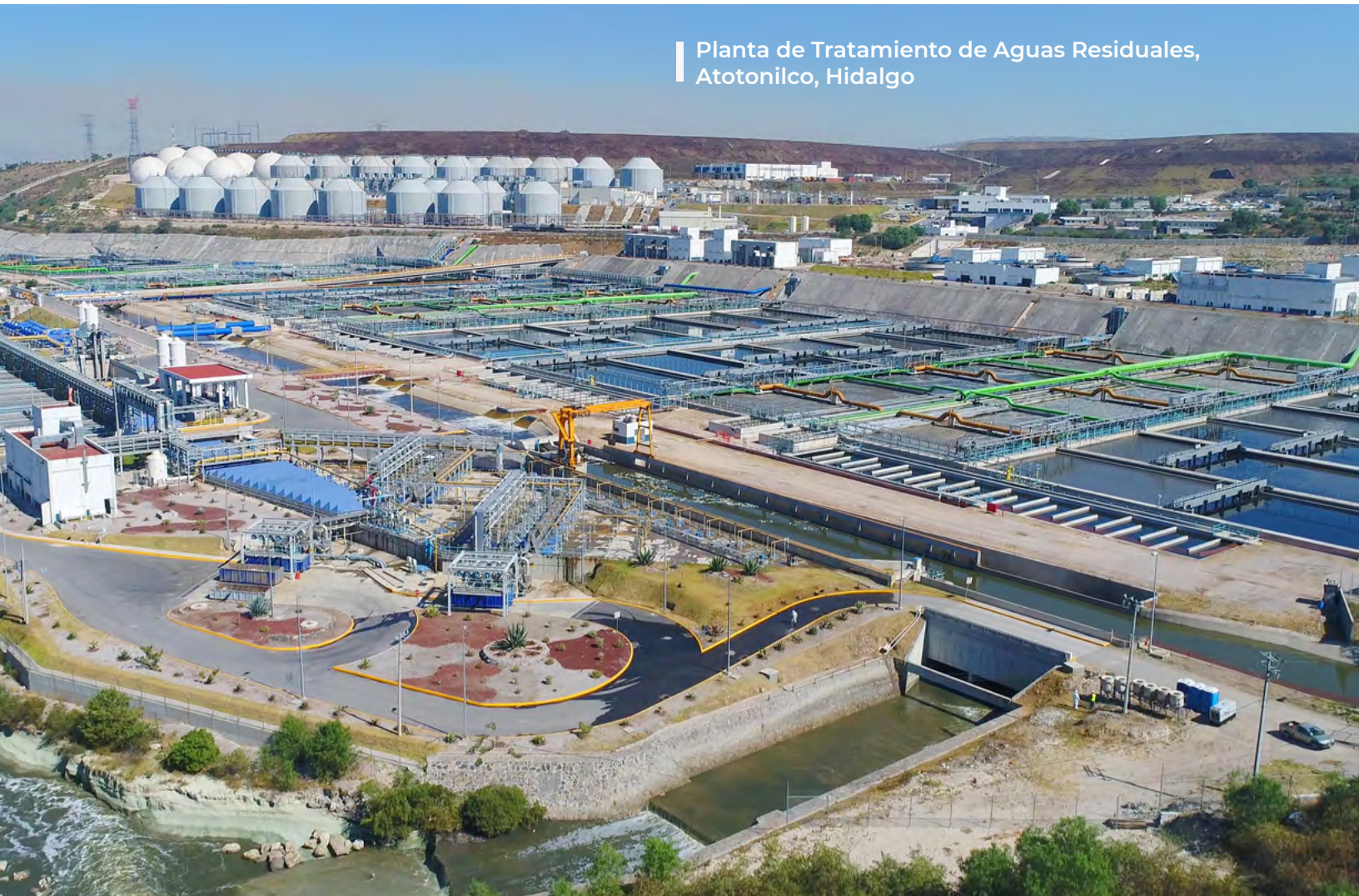
Planta de Tratamiento de Aguas Residuales, Atotonilco, Hidalgo

C) Organismos operadores de agua que se encargan de operar, mantener y administrar los sistemas de agua y alcantarillado para brindar estos servicios a la población de los estados o municipios.