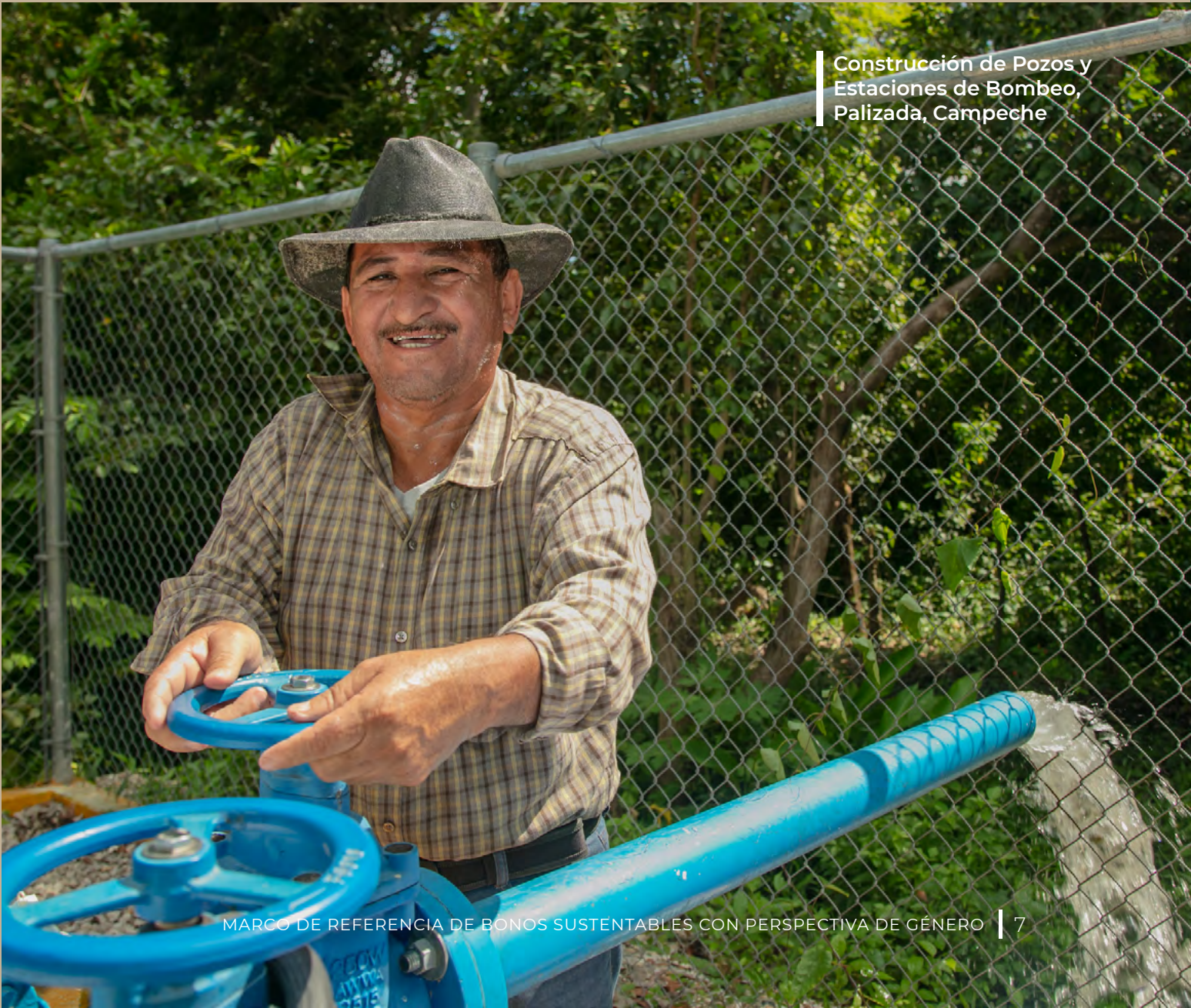
Construcción de Pozos y Estaciones de Bombeo, Palizada, Campeche