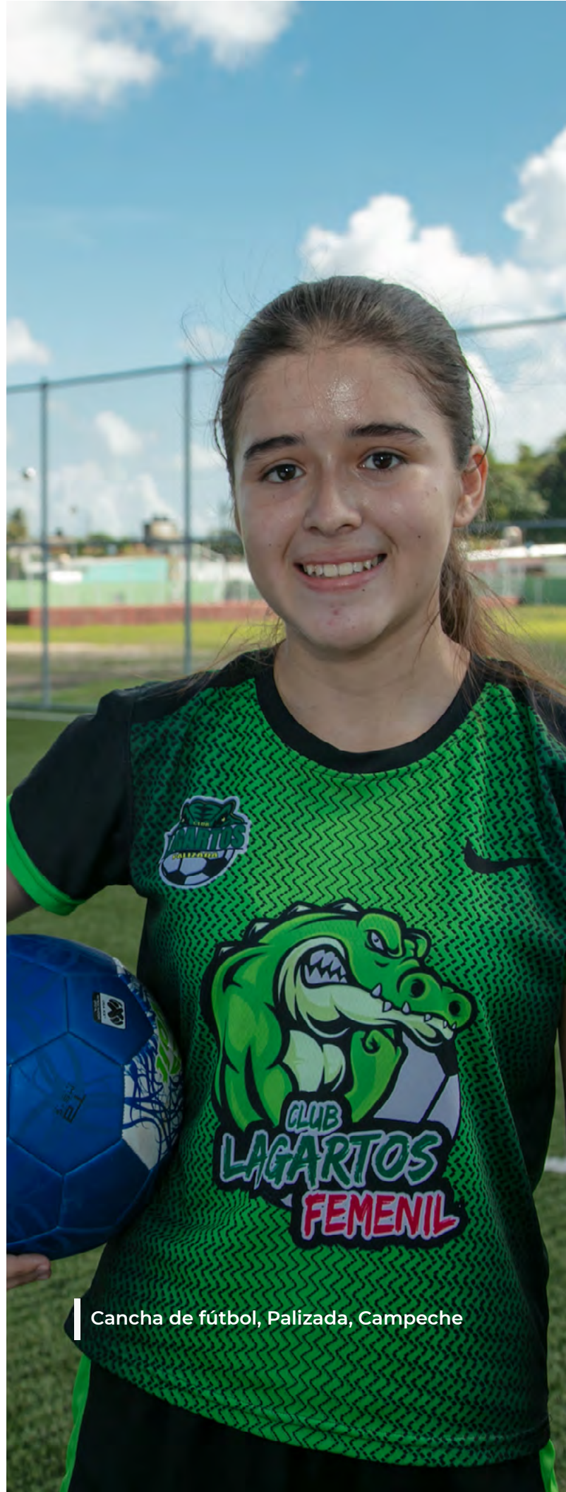
Cancha de fútbol, Palizada, Campeche