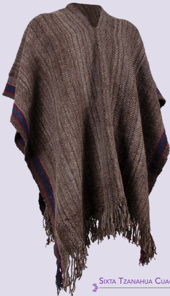
SIXTA TZANAHUA CUAQUEHUA

Nahua Tlaquilpa, Veracruz Jorongo de lana criolla color gris con orillas azules y vino.