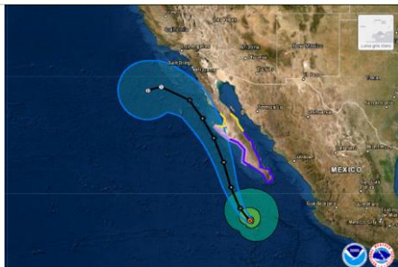
2200 hrs 6/09/22