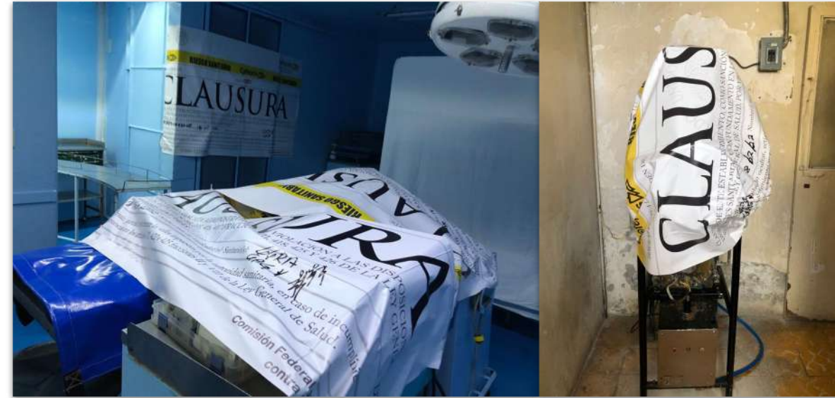
Sala quirúrgica y máquina de anestesia Jal. 22.04.2022 Operativo N1788-19