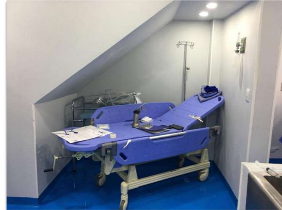
Sala de recuperación postoperatoria Edo Mex. 11.03.2022 Operativo N1778-14