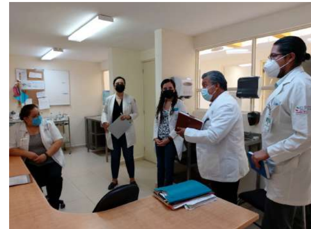
Arranque de levantamiento en unidad de salud