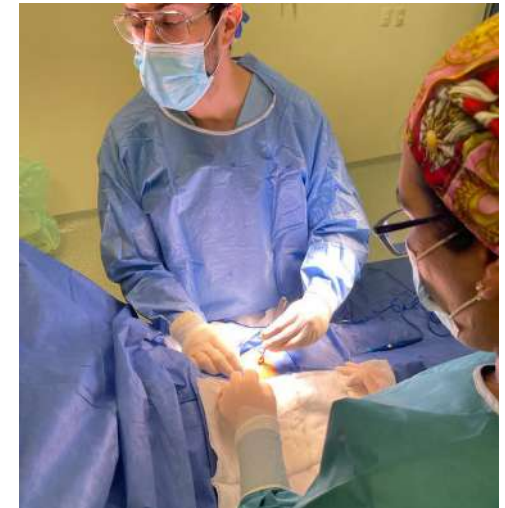
Quirófano del Hospital Comunitario de Tecuala