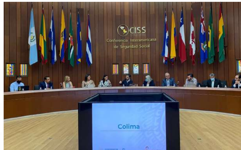
Reunión con la Gobernadora Indira Vizcaíno el 5 de mayo