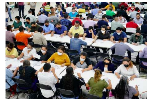
Proceso de regularización en Nayarit