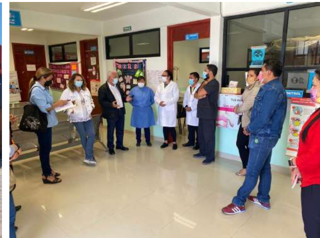
Asambleas comunitarias en Tlaxcala