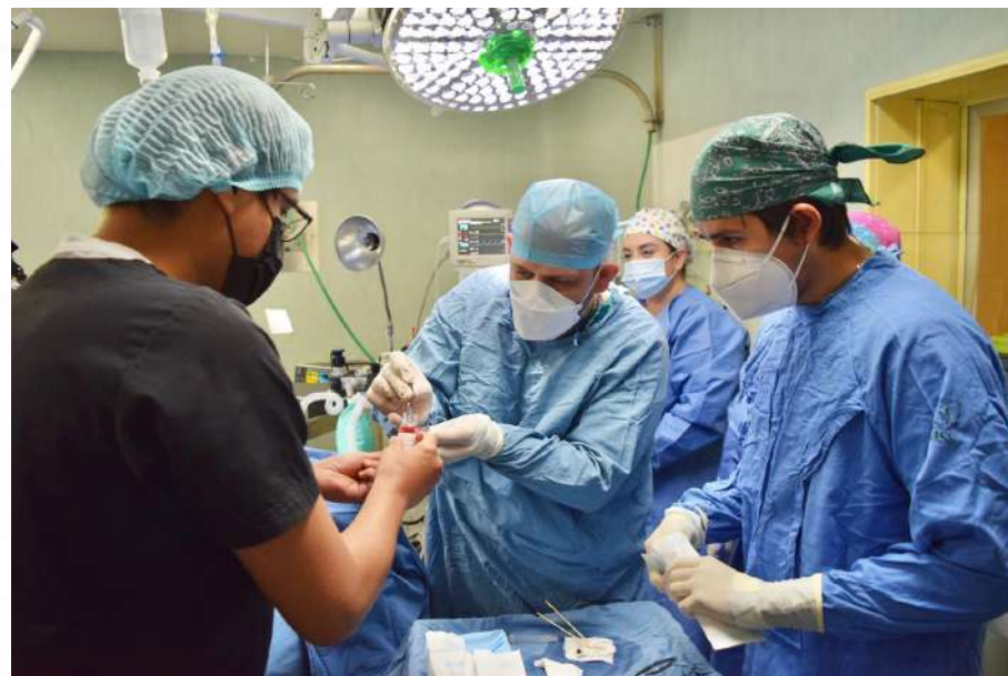
Donación multiorgánica en el Hospital Civil de Tepic