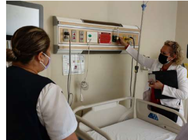
Verificación de funcionamiento de equipamiento