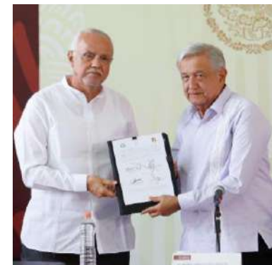
Firma de acuerdo 7 de diciembre del 2021

Transferencia de servicios estatales al IMSS-Bienestar