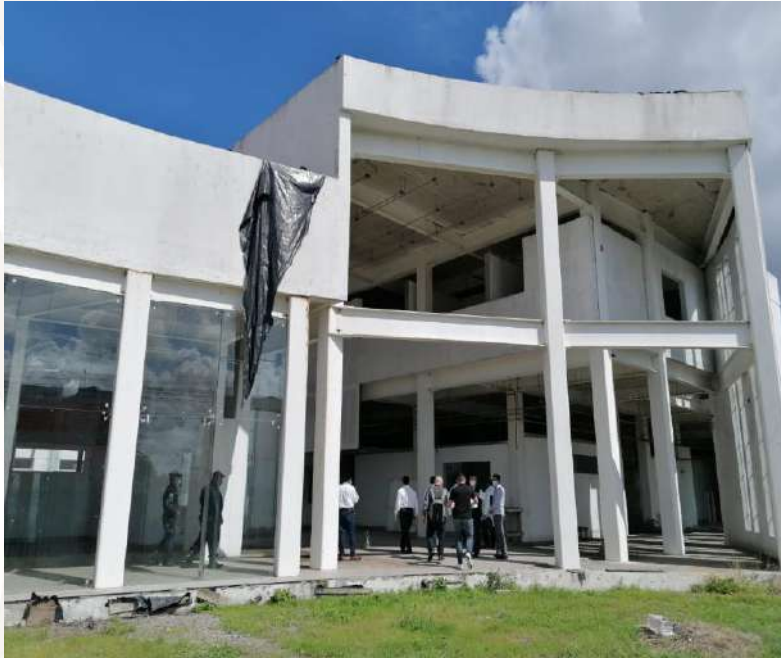
Hospital de la Mujer inició de construcción en el año 2005