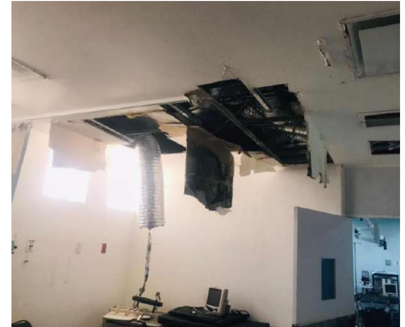
Quirófano inhabilitado por daños en el Hospital Mixto de Jesús María