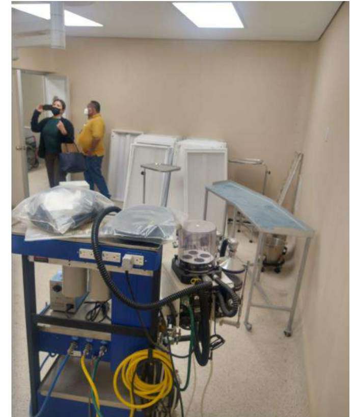
Quirófano del Hospital Puente de Camotlán