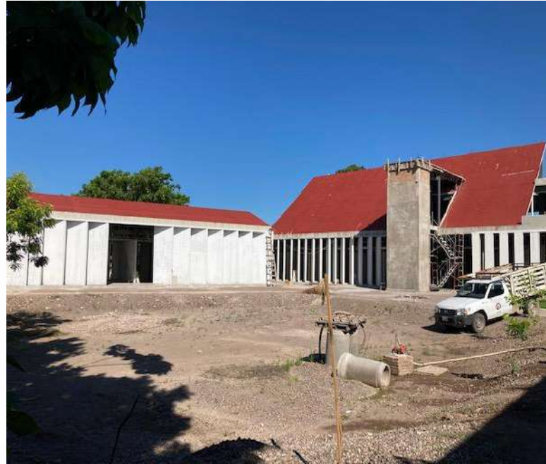
Hospital Integral Tuxpan obra detenida desde el año 2021