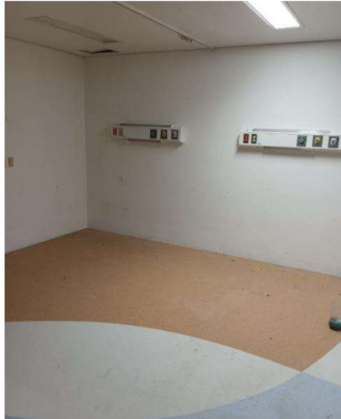
Hospital Básico Comunitario Las Varas, áreas médicas sin equipamiento