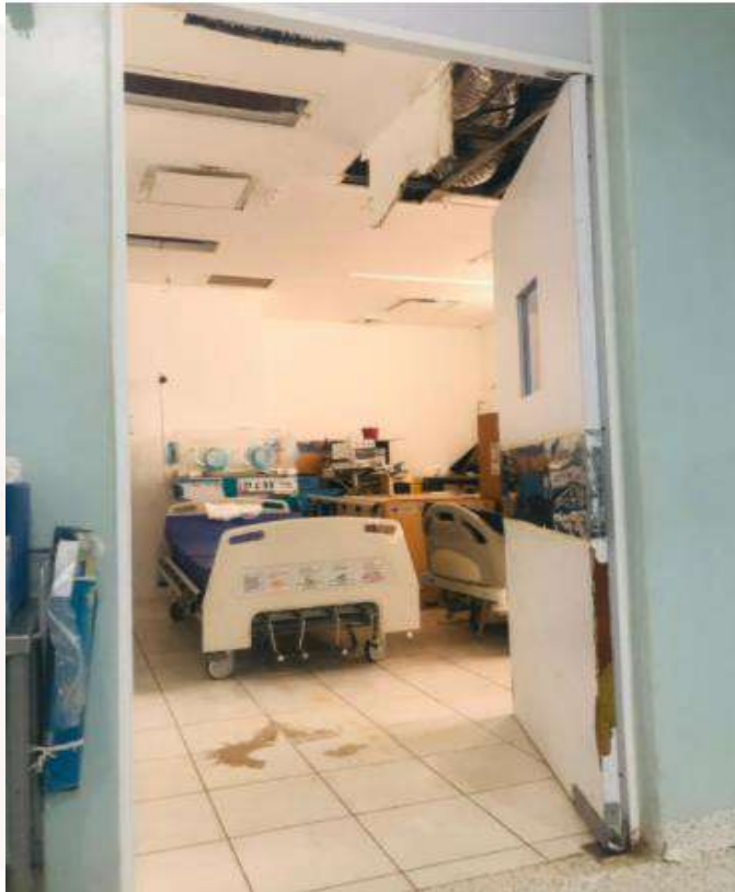
Zona de atención médica en el Hospital Mixto de Jesús María