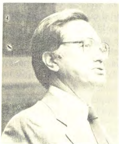
Palabras del Secretario de Educación Pública. Lic. Manuel Bartlett Díaz

Ciudadano Presidente de la República, Ciudadano Presidente de la Comisión Nacional del Deporte, Ciudadanos Secretarios de Estado, Señoras y señores: