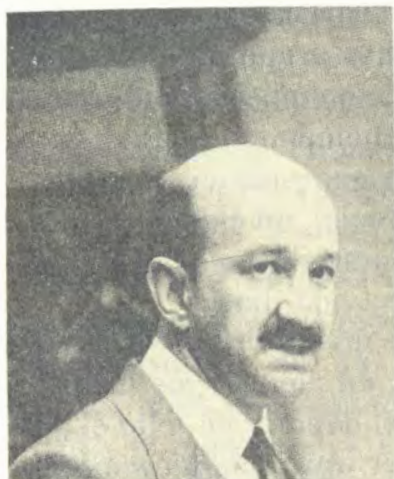
Palabras del Ciudadano Presidente de la República Lic. Carlos Salinas de Gortari