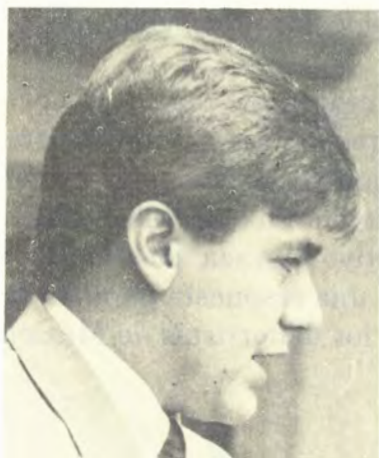
Palabras del medallista olímpico Jesús Mena Campos

Sr. Lic. Carlos Salinas de Gortari, Presidente Constitucional de los Estados Unidos Mexicanos; Distinguidos funcionarios, Amigos deportistas,