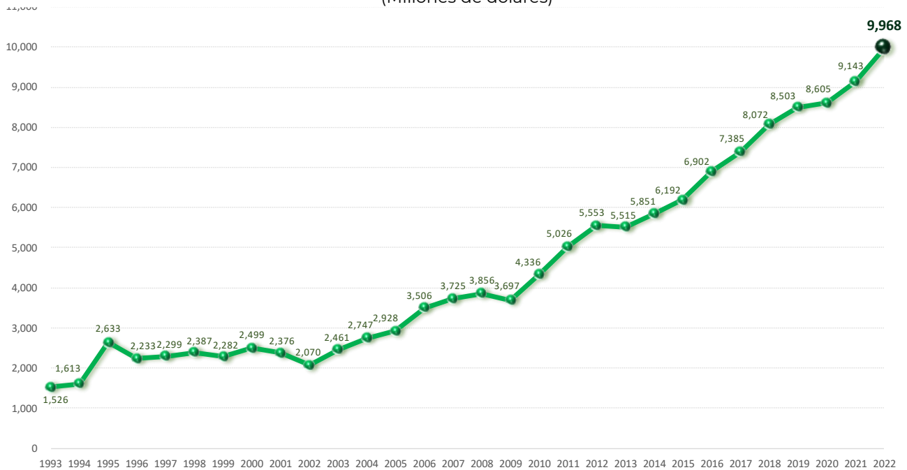
Evolución de las exportaciones agropecuarias y pesqueras de México, enero-mayo 1993-2022 (Millones de dólares)

Fuente: SIAP con datos de Banco de México.