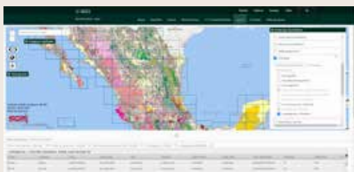
La cobertura de información geológica muestra la distribución de las unidades litológicas y elementos estructurales a nivel nacional derivados de la cartografía a escala 1:250,000 y 1:50,000.