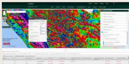
El mapa magnético de campo total muestra la respuesta de susceptibilidad magnética de las rocas en la superficie y en el subsuelo.