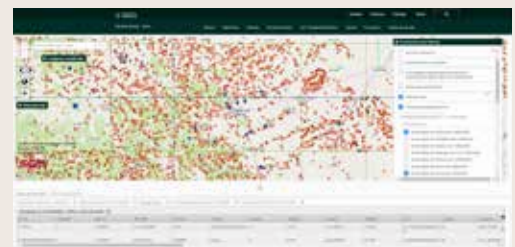
Mapa geoquímico de distribución de muestras de sedimento de arroyo activo, con resultados cuantitativos de Au + 32 elementos.

Blvd. Felipe Ángeles Km 93.50-4, Col. Venta Prieta, C.P. 42083, Pachuca, Hgo. México.