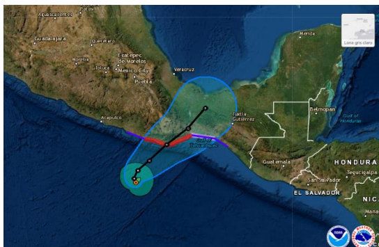
1600 hrs 28/05/202