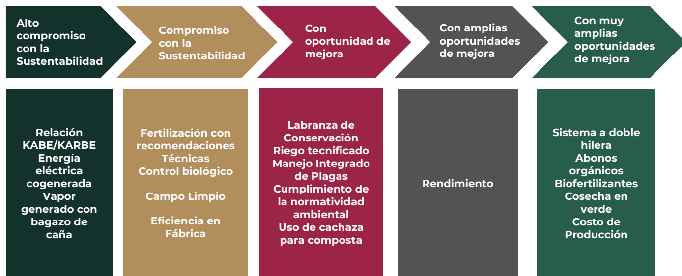
Figura 1. Desempeño de las acciones de sustentabilidad, durante la zafra 2020/2021.

Para obtener más información, puede consultar la siguiente liga electrónica: