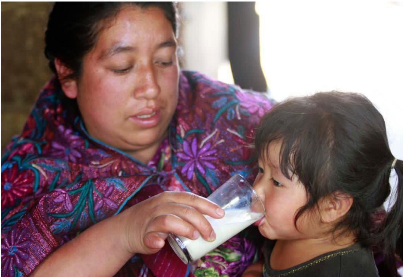
Niñas y niños población objetivo PASL.

La cobertura en la atención a beneficiarios del PASL fue de 67.79% (3'830,700), en el ámbito urbano y 32.21% (1'819,754) en las zonas semiurbano-rurales.