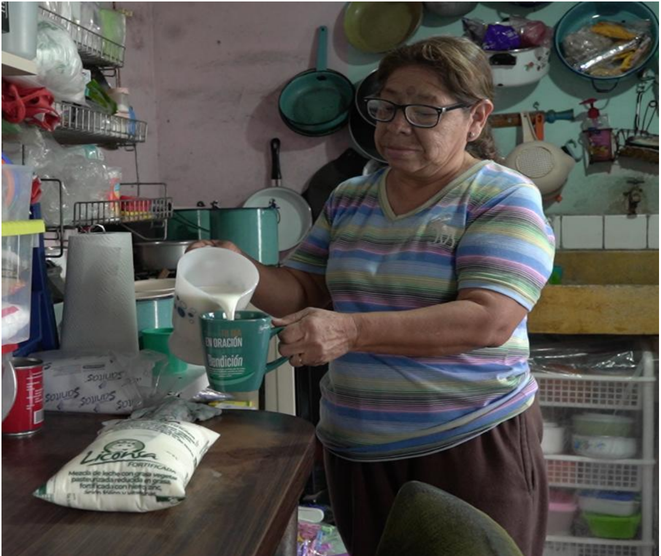
Adultos mayores población objetivo PASL.