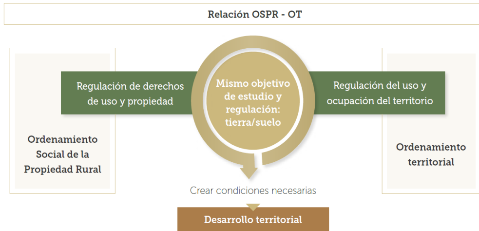
a) Fuente: Cartilla Ordenamiento Social de la Propiedad Rural (OSPR), p. 7

En particular el enfoque de esta política está orientado a la incorporación del OSPR como el instrumento para conectar los derechos de uso y propiedad sobre la tierra de quienes habitan y ocupan el territorio, con la administración y regulación del espacio físico y del suelo de un territorio. Esta incorporación se materializa acopiando la información del municipio en materia de tenencia de tierras desarrollando un diagnóstico sobre el estado de cosas en el territorio en relación con los derechos de uso y propiedad sobre la tierra y formulando (luego de analizar el diagnóstico), medidas que faciliten la gestión predial que contribuyan a prevenir o disminuir los conflictos que pudieran surgir de la implementación del POT y que atiendan las necesidades de tierras de los habitantes rurales.