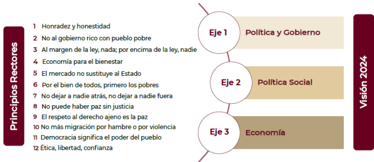
Figura 1. Estructura del Plan

A continuación se resume el contenido temático de los principios rectores y los tres Ejes Generales del Plan.