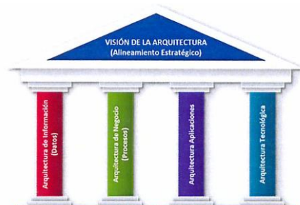
Ilustración 5: Arquitectura empresarial de acuerdo con TOGAF (The Open Group Architecture Framework) o Esquema de Arquitectura del Open Group, en español.