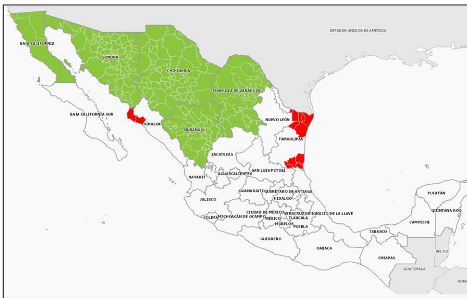
Fig.1.- Áreas libres de gusano rosado ( Pectinophora gossypiella ), en el 2022.

Al mes de enero del 2022, las Entidades con reconocimiento oficial de zona libre de gusano rosado y picudo del algodón conservaron su estatus. Para el caso de gusano rosado corresponde a las entidades de Baja California, Sonora, Chihuahua, Coahuila y Durango ( Fig.1 ). Asimismo, respecto al picudo del algodón las entidades de Baja California y Chihuahua, los municipios de Altar, Caborca, General Plutarco Elías Calles, Pitiquito y San Luis Río Colorado de la Entidad federativa de Sonora, y el municipio de Sierra Mojada, Coahuila ( Fig.2 ).