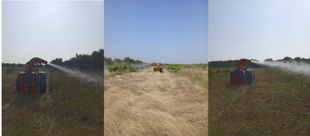
Figura 3. Control de adultos San Luis Potosí.