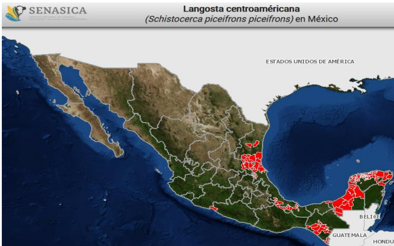
Figura 1. Estados en los que se tiene presencia de langosta al mes de enero del 2022.

En México, la Langosta centroamericana ( Schistocerca piceifrons piceifrons , Walker, 1870) se encuentra presente en 10 Entidades Federativas (Campeche, Chiapas, Hidalgo, Oaxaca, Quintana Roo, San Luis Potosí, Tabasco, Tamaulipas, Veracruz y Yucatán) (Figura 1), por lo que, con el objetivo de reducir los niveles de infestación del insecto y prevenir la formación de bandos o mangas que pudieran causar pérdidas o daños a la producción agrícola, se implementa la campaña en esos Estados; para ello se realizan las acciones de exploración, muestreo y control de la plaga (químico y biológico) con recursos del Programa de Sanidad e Inocuidad Agroalimentaria de la Secretaría de Agricultura y Desarrollo Rural, para el ejercicio 2022 a través de las Instancias Ejecutoras.