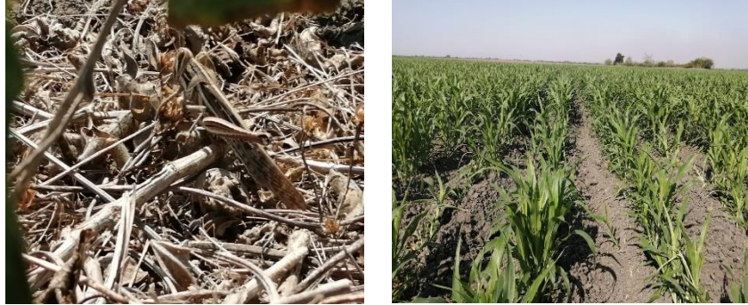
Figura 2. Exploración y muestreo de Langosta en San Luis Potosí.

Control. En este mes se realizaron acciones de control de 21 brotes de poblaciones de Langosta en etapa de adulto, fase solitaria (manchón y solitarios), que sobrepasaron las densidades máximas permisibles en la normativa, en una superficie de 183 hectáreas en los estados de Chiapas, San Luis Potosí, y Tamaulipas, mediante aplicaciones de insecticida.