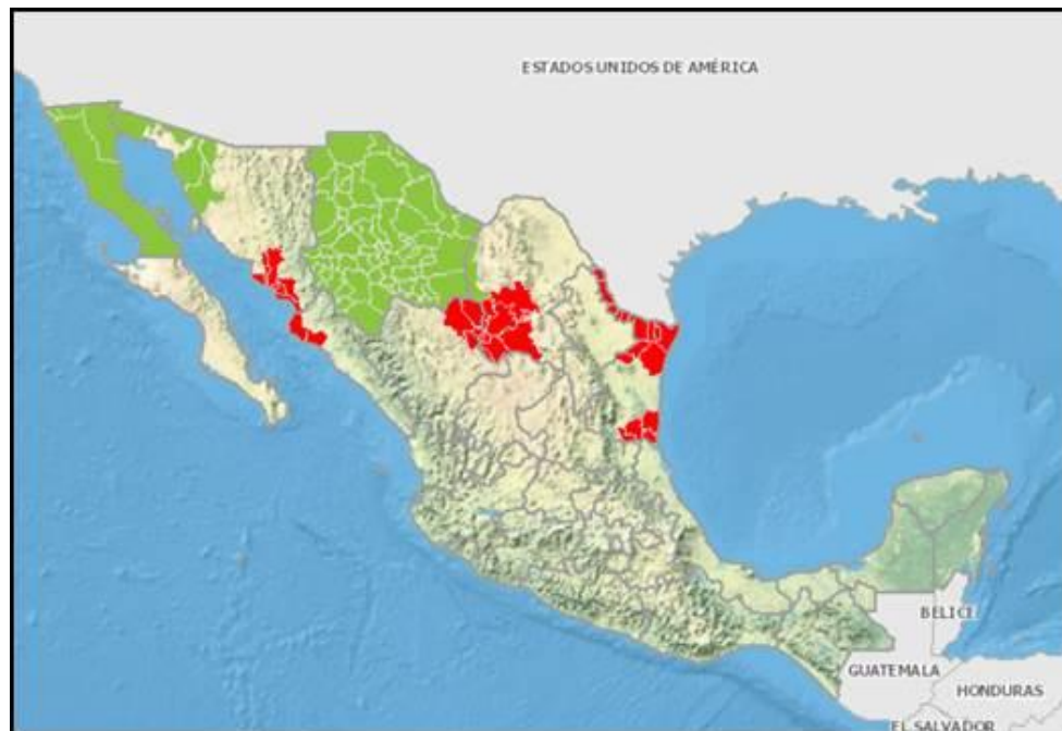
Fig. 2.- Áreas libres de picudo del algodón ( Anthonomus grandis ), en el 2021. Fuente: Mapa dinámico fitosanitario, SENASICA, 2021.