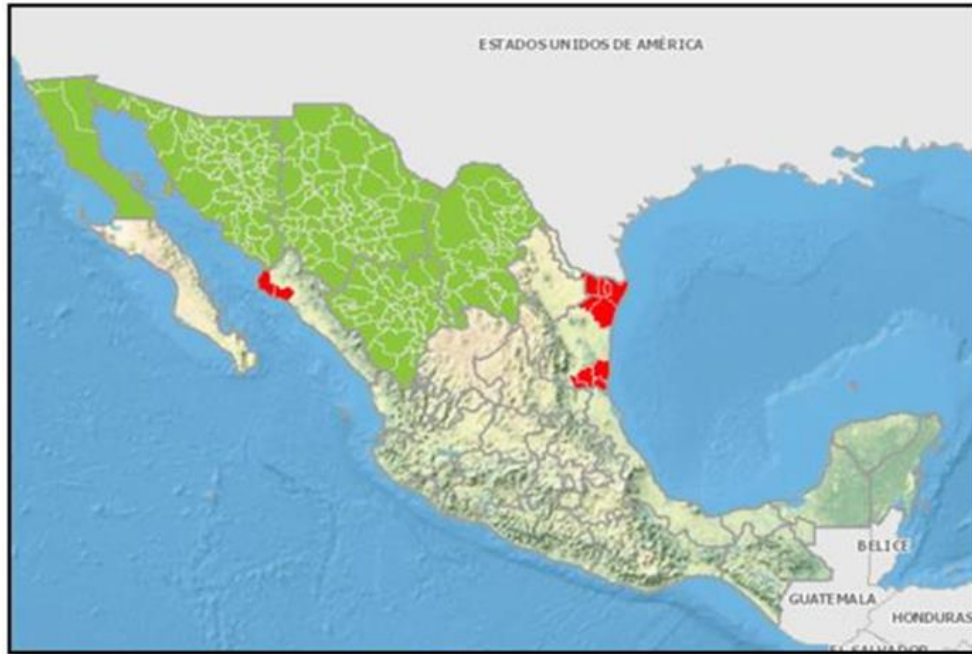
Fig.1.- Áreas libres de gusano rosado ( Pectinophora gossypiella ), en el 2021.