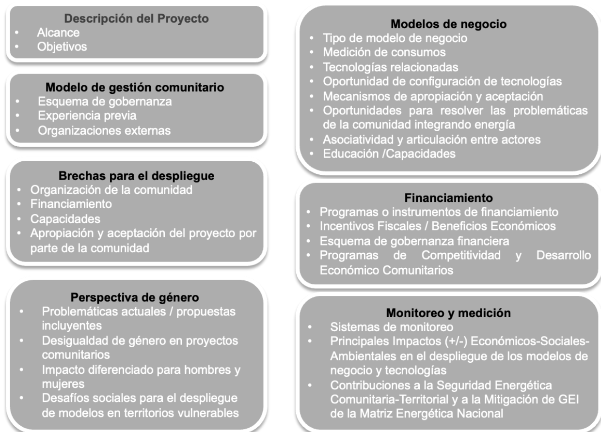
Ilustración 2. Criterios para la evaluación de proyectos

Para la identificación de buenas prácticas que pueden brindar apoyo para la implementación de nuevos proyectos se realizó un análisis (ver Ilustración 8) a partir de la información de cinco proyectos piloto (Tlaquepaque, Cuetzalan, Punta Allen, Parres y Topilejo) y dos acompañamientos técnicos (Coatepec y San Lorenzo Cacaotepec) se obtuvieron las siguientes conclusiones que facilitarán la implementación de nuevos proyectos.