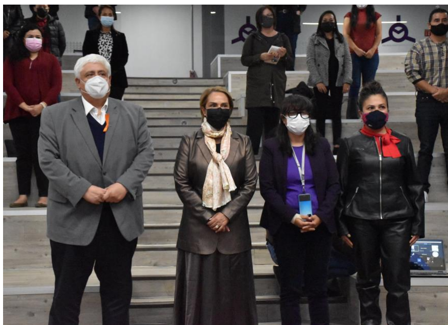
2° Foro Estatal sobre Agenda y Liderazgo de Derechos Sexuales y Reproductivos de las Personas Adolescentes