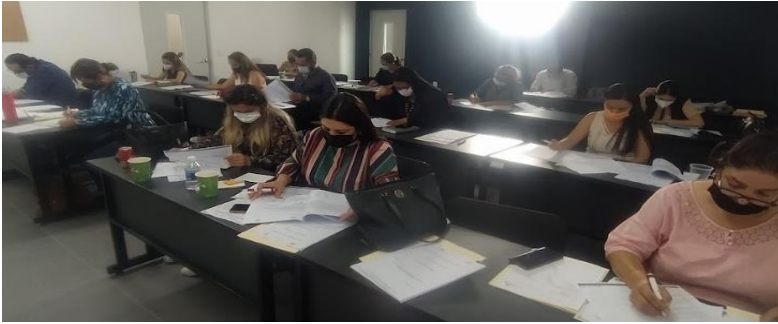
Comité Del Nayar