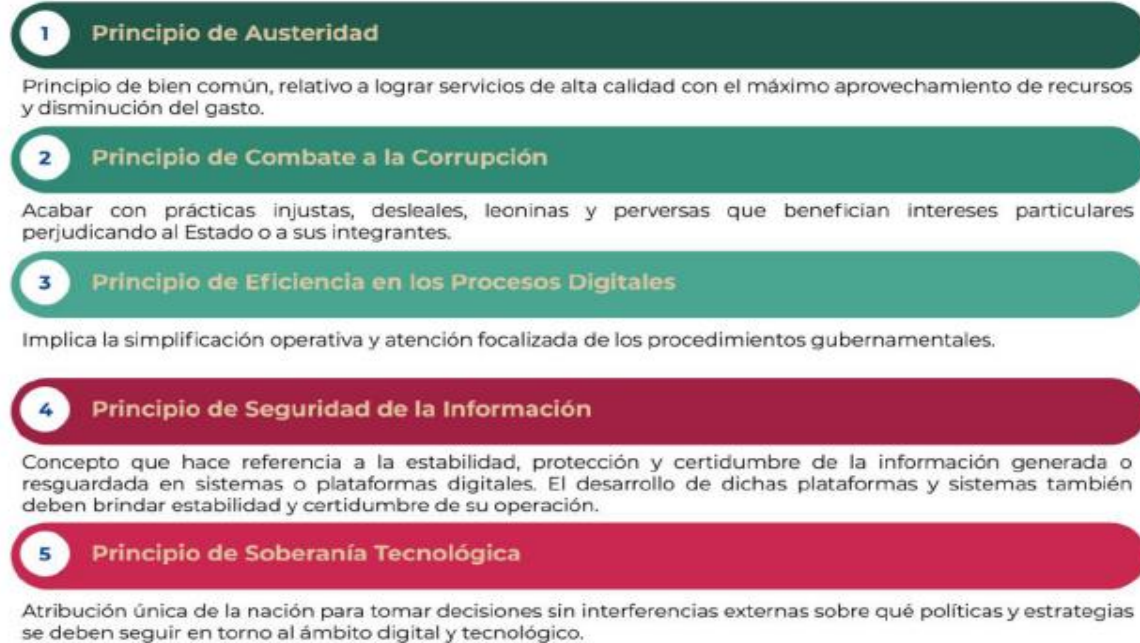
Figura 1. Principios de la EDN

La EDN aterriza las capacidades gubernamentales en la prioridad de atender los planteamientos de una adecuada gobernanza tecnológica, la mejora de los servicios digitales y la optimización de los procesos, enmarcando dichos propósitos en los siguientes principios: