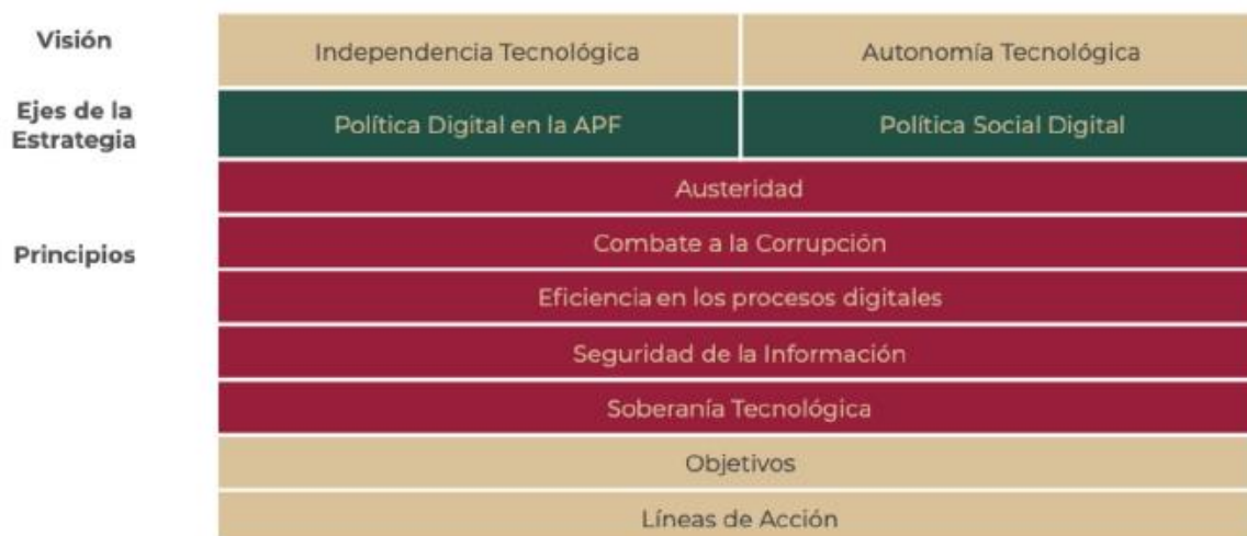
Figura 3. Marco estructural de la EDN

Los dos objetivos generales de la estrategia se componen de nueve objetivos específicos y líneas de acción identificadas como relevantes en materia de tecnologías, gobierno digital, conectividad, inclusión digital, software libre ii , estándares abiertos, digitalización de trámites, sistemas e infraestructura interoperables y seguridad de la información, que orientan el quehacer de las dependencias y entidades para dar sentido, unicidad y congruencia a esta Estrategia, cuya finalidad es una transformación centrada en las y los ciudadanos.