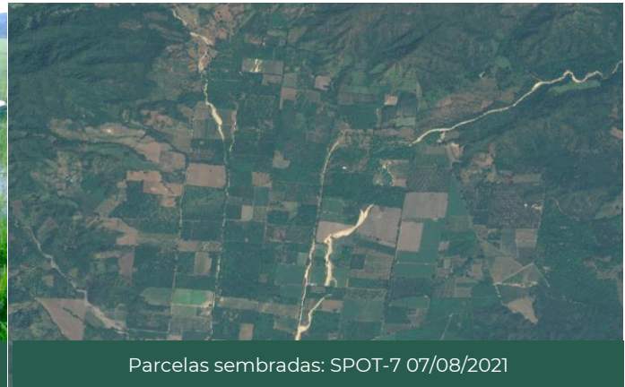
Figura 1. Zonas agrícolas Nuevo Cuyutlán, Manzanillo, Colima, México.

De las 142,297 hectáreas identificadas como zonas susceptibles de ser cultivadas , el 3.4% está cubierta por este tipo de cultivos, destacando el municipio de Colima con cerca de 1,096.6 hectáreas sembradas. Por su parte, el maíz grano es el más representativo con 3,664.1 hectáreas sembradas en el Estado.