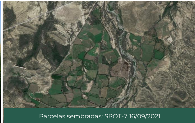
Figura 1. Zonas agrícolas Mesillas, Ramos Arizpe, Coahuila de Zaragoza, México.

De las 423,448 hectáreas identificadas como zonas susceptibles de ser cultivadas , el 9% está cubierta por este tipo de cultivos, destacando el municipio de Saltillo con cerca de 9,745.1 hectáreas sembradas. Por su parte, el maíz grano es el más representativo con 24,632.9 hectáreas sembradas en el Estado.