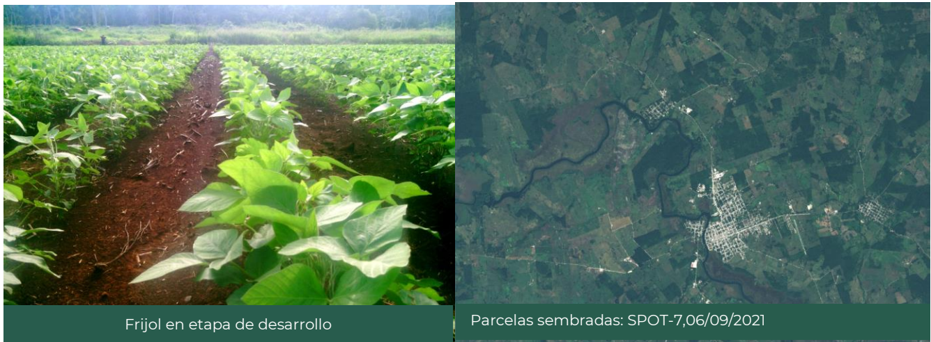
Figura 1. Zonas agrícolas El Porvenir, Candelaria, Campeche, México.

La estimación de superficie sembrada de maíz grano, sorgo grano, frijol y arroz del estado de Campeche fue generada mediante 190 parcelas georreferenciadas y el análisis satelital de 31 imágenes SPOT, las cuales son obtenidas por la Estación de Recepción México ( ERMEX-SIAP ).