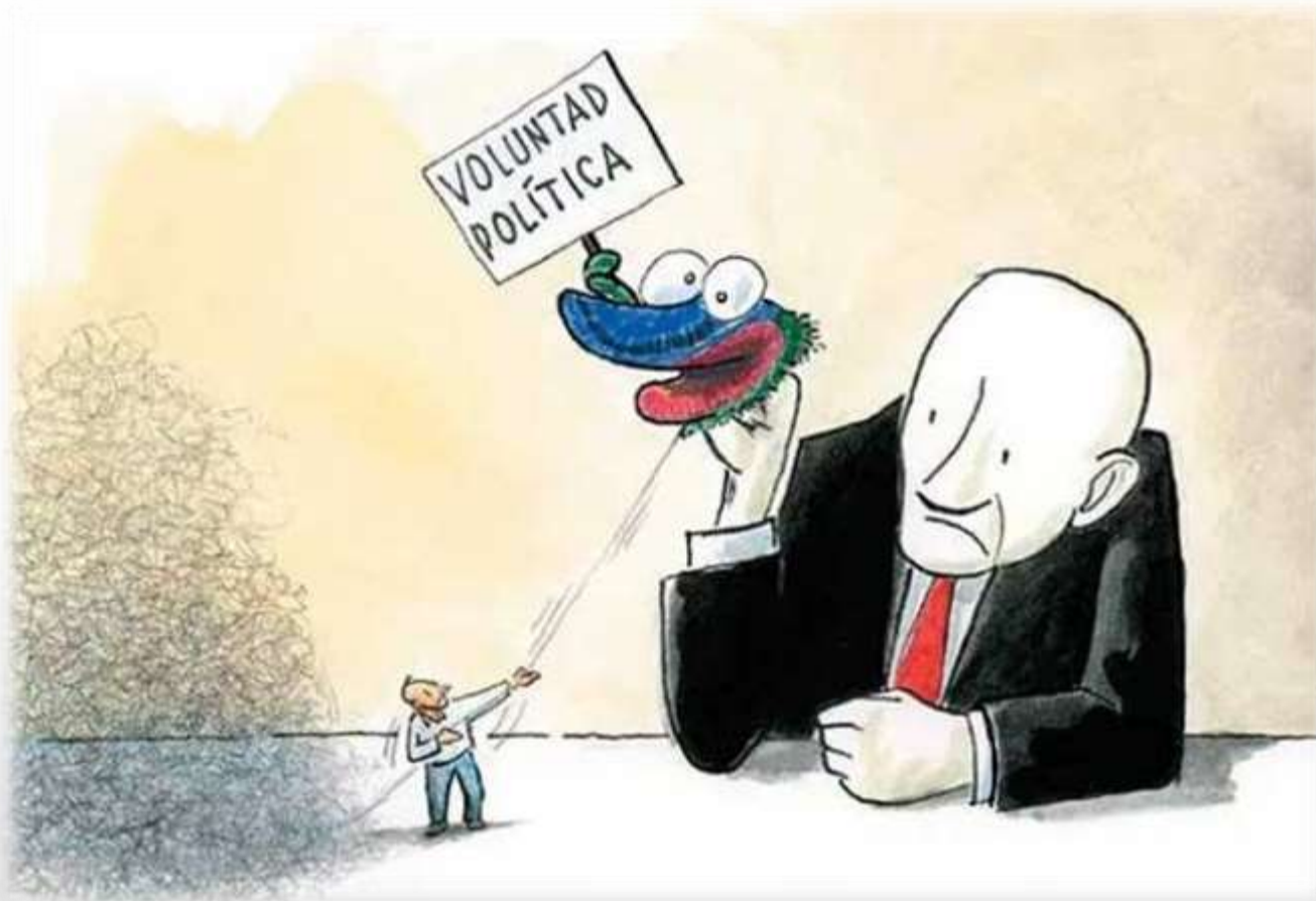
Ilustración: Víctor Solís

https://anticorruptcion.nexos.com.mx/voluntad-politica-cuanto-se-hace-en-verdad/