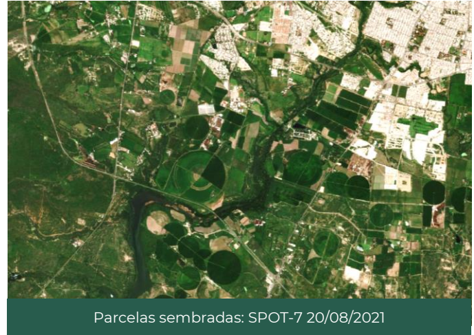
Figura 1. Zonas agrícolas de Aguascalientes, Aguascalientes, México.

De las 154,655 hectáreas identificadas como zonas susceptibles de ser cultivadas , el 68.2% está cubierta por este tipo de cultivos, destacando el municipio de Aguascalientes con cerca de 20,518 hectáreas sembradas. Por su parte, el maíz grano es el más representativo con 81,297.5 hectáreas sembradas en el Estado.