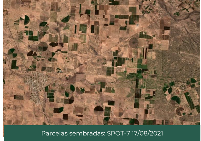
Figura 1. Zonas agrícolas Ciudad Insurgentes, Comondú, Baja California Sur, México.

De las 86,222 hectáreas identificadas como zonas susceptibles de ser cultivadas , el 26.2% está cubierta por este tipo de cultivos, destacando el municipio de Comondú con cerca de 19,226 hectáreas sembradas . Por su parte, el maíz grano es el más representativo con 14,754 hectáreas sembradas en el Estado.