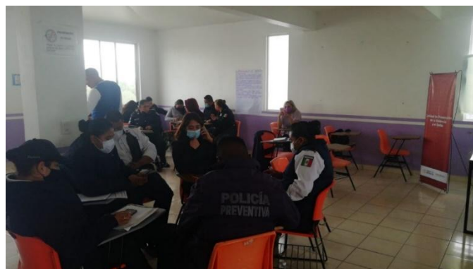
Temascalapa, Estado de México