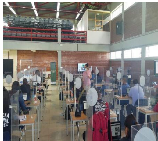
Nezahualcóyotl, Estado de México