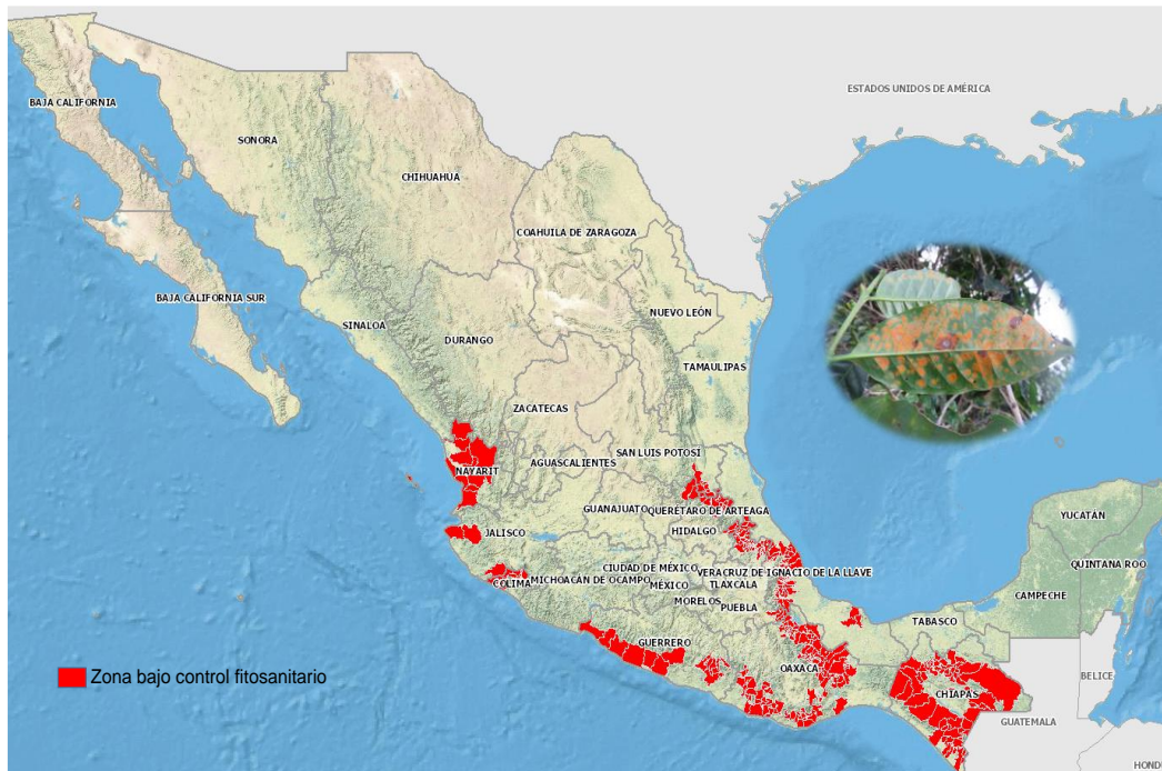
Figura 2. Municipios con presencia de la roya del café.

Por otro lado, con relación a la roya del café y con base en los registros del programa fitosanitario contra la roya del café durante el ejercicio 2018, está presente en las principales zonas productoras de café del país (Figura 2). Asimismo, los niveles de incidencia y severidad están en función del manejo de los cafetales por parte de los cafeticultores.