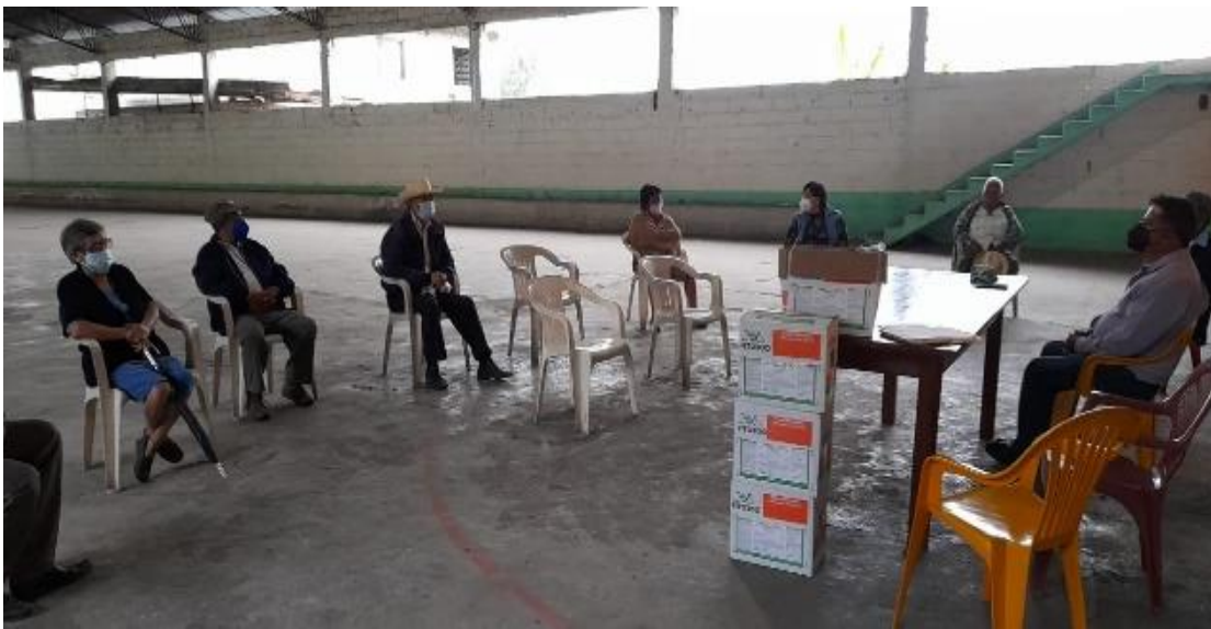
Figura 3. Capacitación a productores