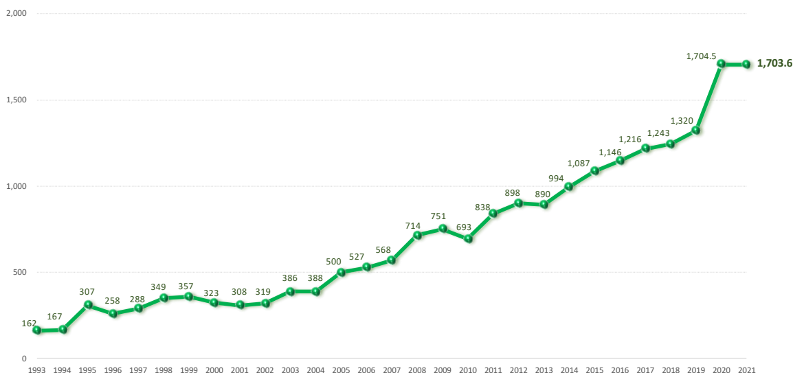
Evolución de las exportaciones agropecuarias y pesqueras de México, junio 1993-2021 (Millones de dólares)

Fuente: SIAP con datos de Banco de México.