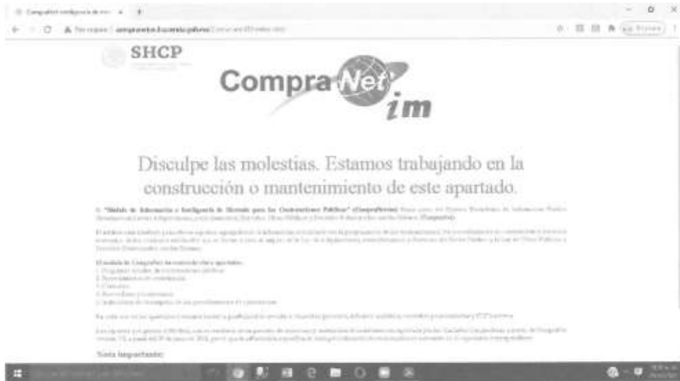
Imagen de la página de ingreso a CompraNet-im del 29 de marzo de 2021

No se ha podido realizar la búsqueda debido a que la página se encuentra en mantenimiento.