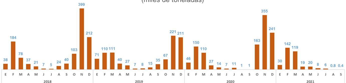
Evolución mensual de la producción de frijol 2018-2021 (miles de toneladas)

En cuanto al frijol negro, el precio medio rural fue de $15,60 pesos por kilogramo, 4.0% más comparado con el mes anterior y 2.5% superior respecto de similar mes de 2020. El precio al mayoreo fue de $22.25 pesos por kilogramo, superando en 0.9% al pagado en junio pasado. El precio pagado por el consumidor fue de $32.75 pesos por kilogramo, 7.0% mayor en comparativos mensuales y 7.8% inferior en comparativos anuales.