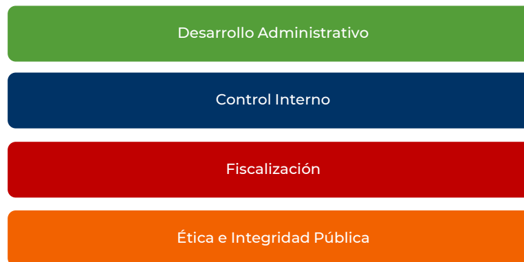
FIGURA 1. PILARES DE LA EVALUACIÓN DE LA GESTIÓN GUBERNAMENTAL

Desarrollo administrativo. Se refiere al conjunto de actividades destinadas a promover un mejor ejercicio de los recursos públicos, además de buscar un incremento de la eficacia y eficiencia gubernamental, mediante un gobierno moderno, abierto e íntegro, orientado a resultados. En este pilar se verifica el cumplimiento de las metas de los indicadores comprometidos en los programas derivados del PND, así como la calidad y oportunidad con que los padrones de beneficiarios fueron integrados en el Sistema Integral de Información de Padrones de Programas Gubernamentales (SIIPP-G).