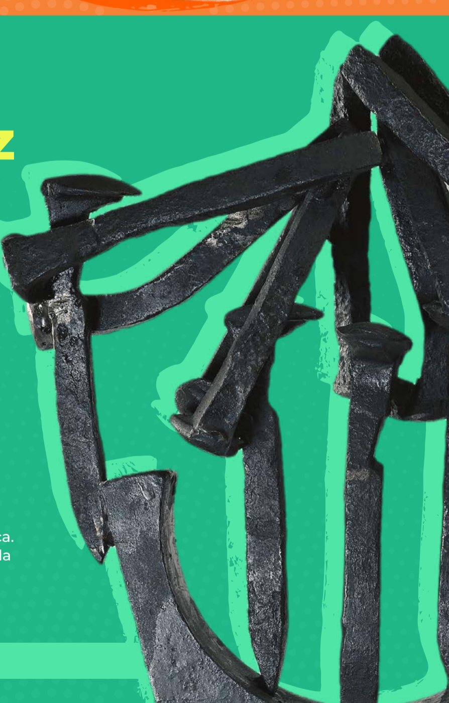
Con los brazos en alto, s/f, hierro soldado, Colección Pago en Especie, SHCP (detalle)

Pintora, dibujante y escultora, su obra, de evidente perfil tenebrista y sombrío, deriva de una formación autodidacta, influenciada desde sus inicios por su cercanía a los artistas europeos exiliados en México como Remedios Varo y Leonora Carrington y por los movimientos surrealista y expresionista. Artista multidisciplinaria, exploró la tradición pictórica y escultórica y tuvo acercamientos con la instalación, el arte efímero, la intervención y la acción plástica. Fue contemporánea de la Generación de la Ruptura. Ingresó a la Colección Pago en Especie en 1983.