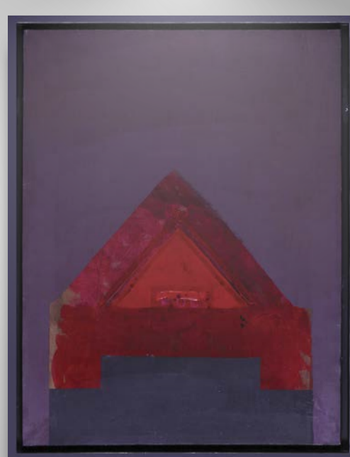
Señal 70 No. 1, s/f, mixta sobre masonite, Colección Pago en Especie, SHCP

Mediante un recorrido virtual guiado, con interpretación en lengua de señas mexicana, disfrutarás las obras de este artista que se encuentran bajo resguardo en las colecciones de la SHCP.