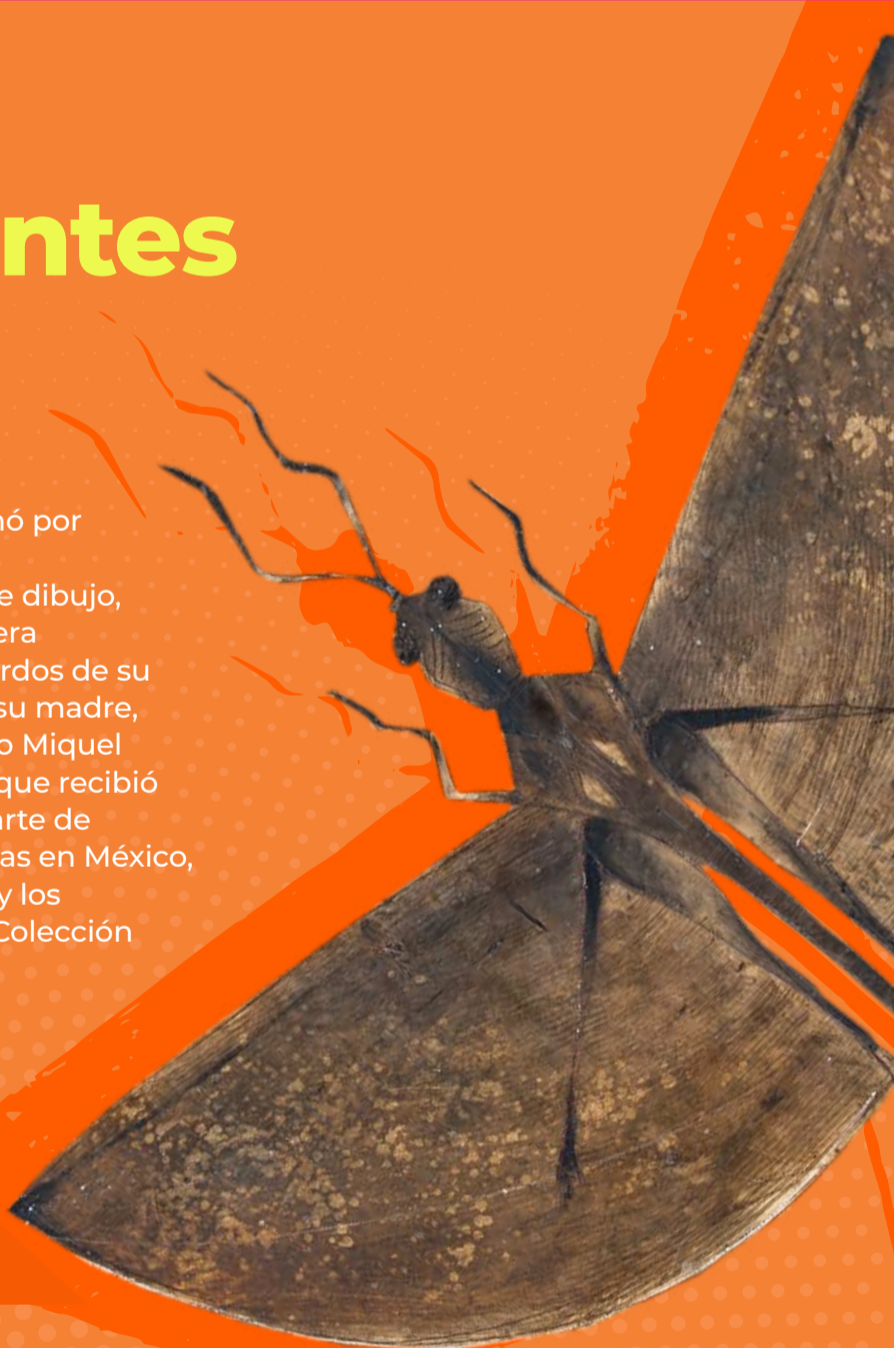
Había una vez en Santa Ana, 2008, mixta sobre tela, Colección Pago en Especie, SHCP (detalle)

Estudió diseño gráfico en Puebla. Se inclinó por la pintura como medio de expresión y complementó su formación con talleres de dibujo, grabado y fotografía, por lo que se considera autodidacta. Su obra se nutre de los recuerdos de su infancia, de su familia, principalmente de su madre, de la influencia de artistas españoles como Miquel Barceló y Antoni Tàpies y de la formación que recibió como diseñador. Sus piezas son parte de importantes colecciones públicas y privadas en México, España, Estados Unidos, Inglaterra, Corea y los Emiratos Árabes, entre otros. Ingresó a la Colección Pago en Especie en 2009.