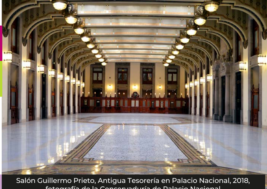
Salón Guillermo Prieto, Antigua Tesorería en Palacio Nacional, 2018

La Dirección General de Promoción Cultural y Acervo Patrimonial y de la Conservaduría de Palacio Nacional de la Secretaría de Hacienda y Crédito Público (SHCP) emite esta edición con motivo del centenario luctuoso de Ramón López Velarde, el 95 aniversario de la inauguración de la Tesorería General en Palacio Nacional y el 30 aniversario luctuoso de Rufino Tamayo. Te invitamos a seguirnos en nuestras redes sociales oficiales Hacienda es Patrimonio Cultural para conocer la serie de actividades académicas y educativas en las que podrás participar desde tu casa.