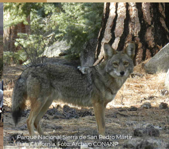
Parque Nacional Sierra de San Pedro Mártir, Baja California.