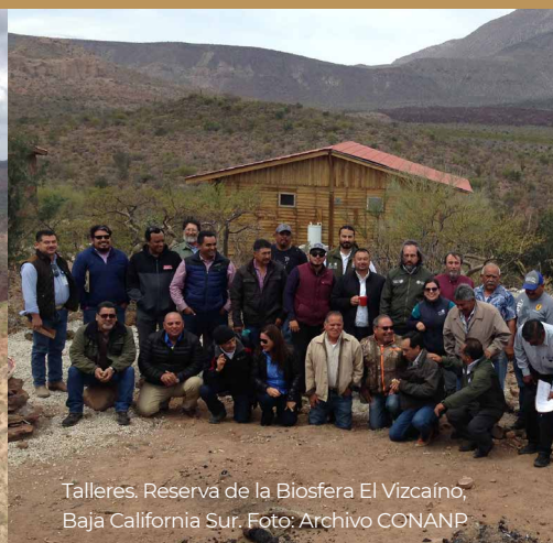
Talleres. Reserva de la Biosfera El Vizcaíno, Baja California Sur.