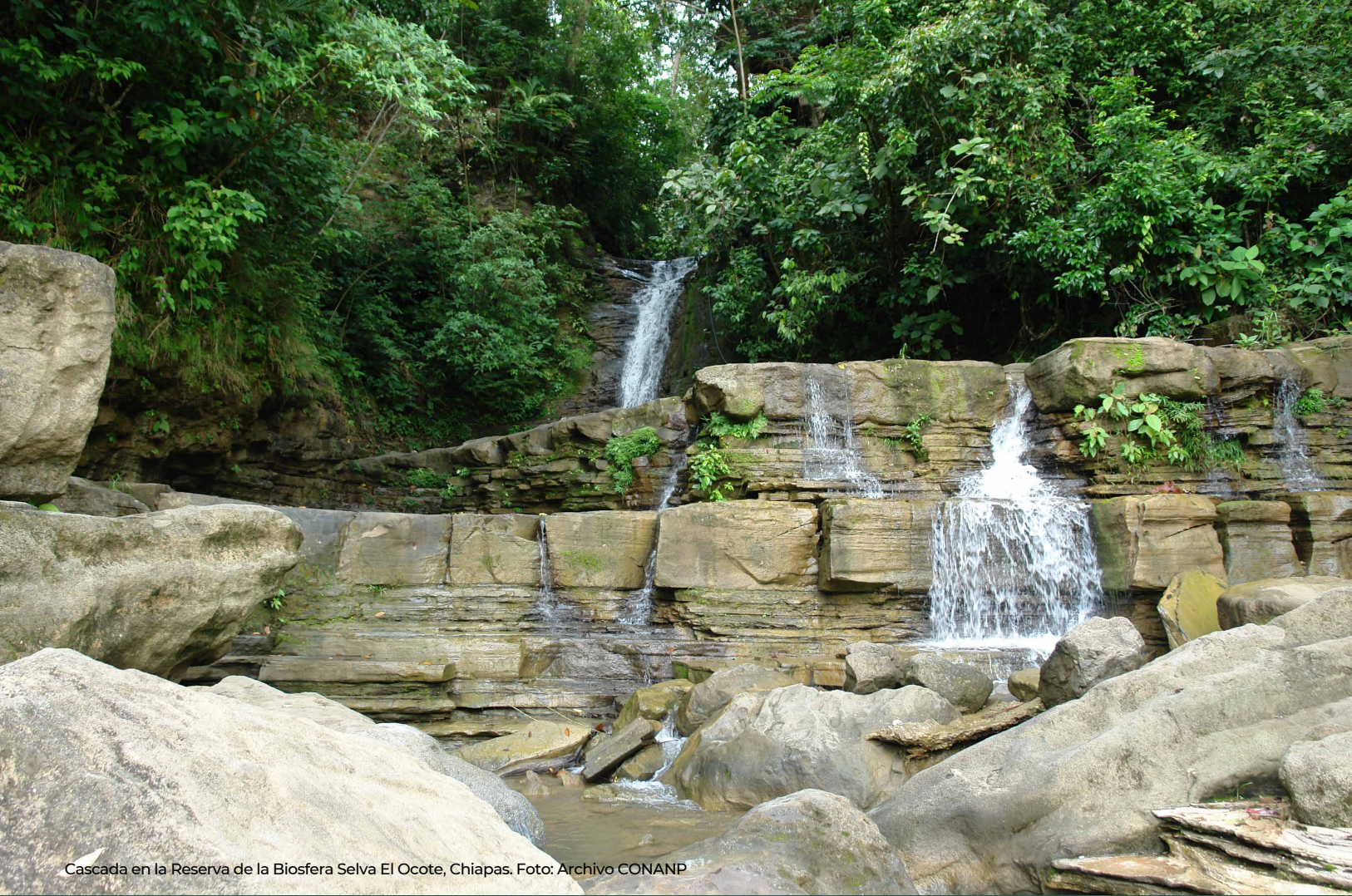
Cascada en la Reserva de la Biosfera Selva El Ocote, Chiapas.