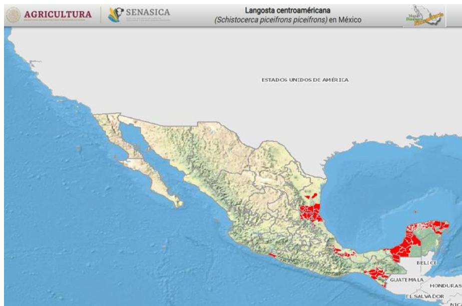
Figura 1. Estados en los que se tiene presencia de langosta al mes de diciembre del 2020.

En el mes de diciembre del 2020 se realizó la acción de exploración en una superficie de 49,334.5 hectáreas, de éstas se muestrearon 5,902 en los estados de Campeche, Chiapas, Hidalgo, Oaxaca, Quintana Roo, San Luis Potosí, Tabasco, Tamaulipas, Veracruz y Yucatán, identificando la presencia de la langosta en estado biológico de ninfa y adulto, tanto gregarios como solitarios, en el caso de ninfas se encontraron en instar N5 en menor proporción, se registró un promedio de infestación de 41 individuos/100 m 2 .